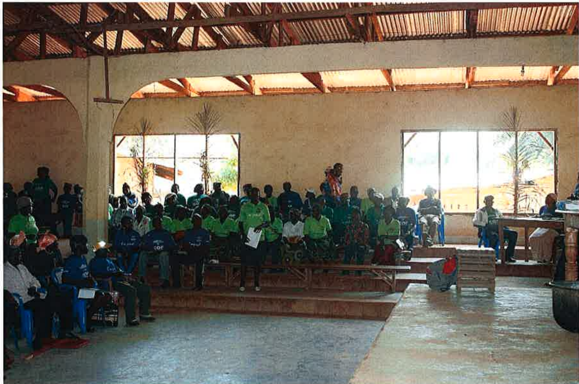
Månedlig kunnskapsforum – med erfaringsutveksling og samfunnspåvirkning

Vi har også startet mer bevisst ledelsesutvikling, for våre COF ansatte og for utvalgte representanter for alle COF gruppene. Vi har tilrettelagt for at også IT-kunnskap vil bli en del av denne lederutvikling. På sikt vil vi planlegge for at dette kunnskapsforum kan bli en permanent «voksenopplæringsinstitusjon» for lokalsamfunnet, uavhengig av COF. Et nytt tilbud i et lokalsamfunn der de fleste voksne har begrenset formell utdanning, og mange voksne kvinner er analfabeter.