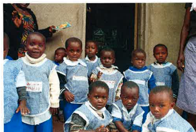
Effekt for hele familien