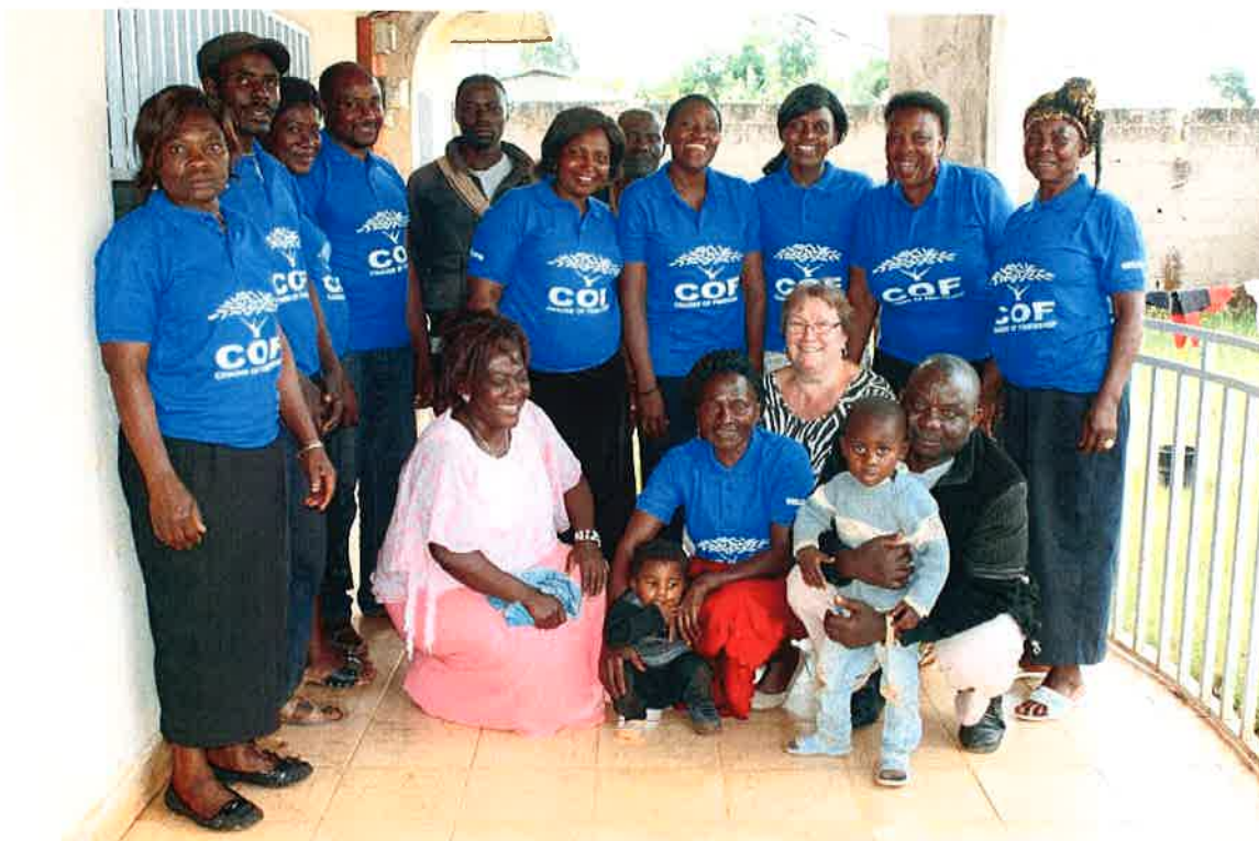
73 aktive grupper- 895 deltakere og deres 8-9.000 familiemedlemmer deltar nå i COF programmet

Resultat av lokalsamfunnets fattigdomsutvikling, i tråd med stiftelsens formål, er omtalt på side 2 under «Utvikling». Der forbedring av fattigdomskriterier ihht FNs Tusenårsmål måles kontinuerlig på individ- og samfunnsnivå. Prioritering av kvinner i programmet fremmer deres egenutvikling og selvstendighet, mens kompetanseutvikling påvirker deres lokale samfunnsutvikling og veien mot uavhengighet av bistandshjelp.