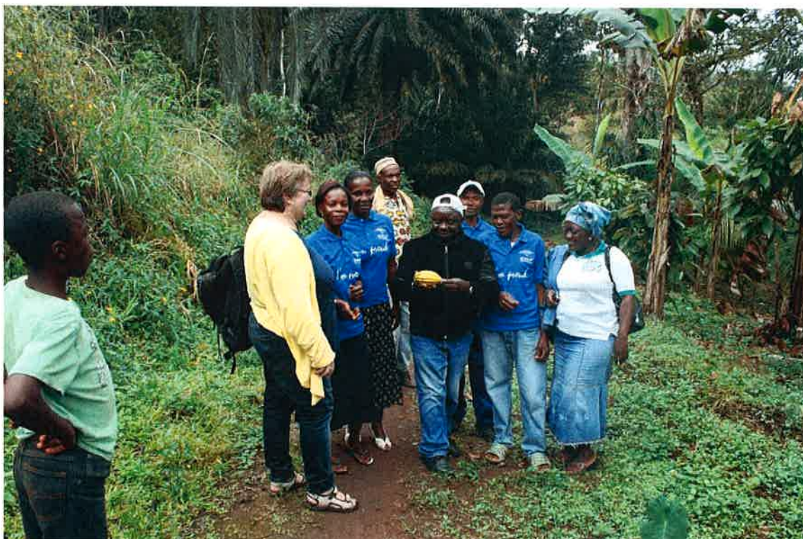
Fellesprosjekt er gruppens sikkerhet og ekstraintekt

Lånegruppe 39 kalt «Hope rising FG» fra landsbyen Bessie Fomukong har valgt å satse på felles investering i kakaoplantasje. En produksjon de har erfart egner seg godt i deres tette skogsområde, og som kan gi kjærkommen kontantinntekt til familienes øvrige behov.