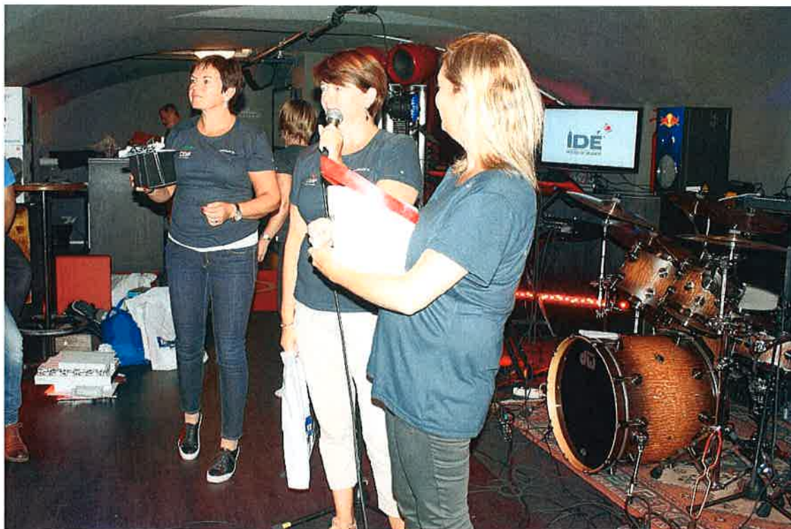
Auksjon på Bergen Gir – ledet av entusiastiske styremedlemmer

Chains of Friendship arrangerte også i 2015 veldedighetsfesten «BERGEN GIR» som nå er blitt en årlig tradisjon. Arrangementet gir i tillegg til inntekt også en utvidelse av vår markedsprofilering.