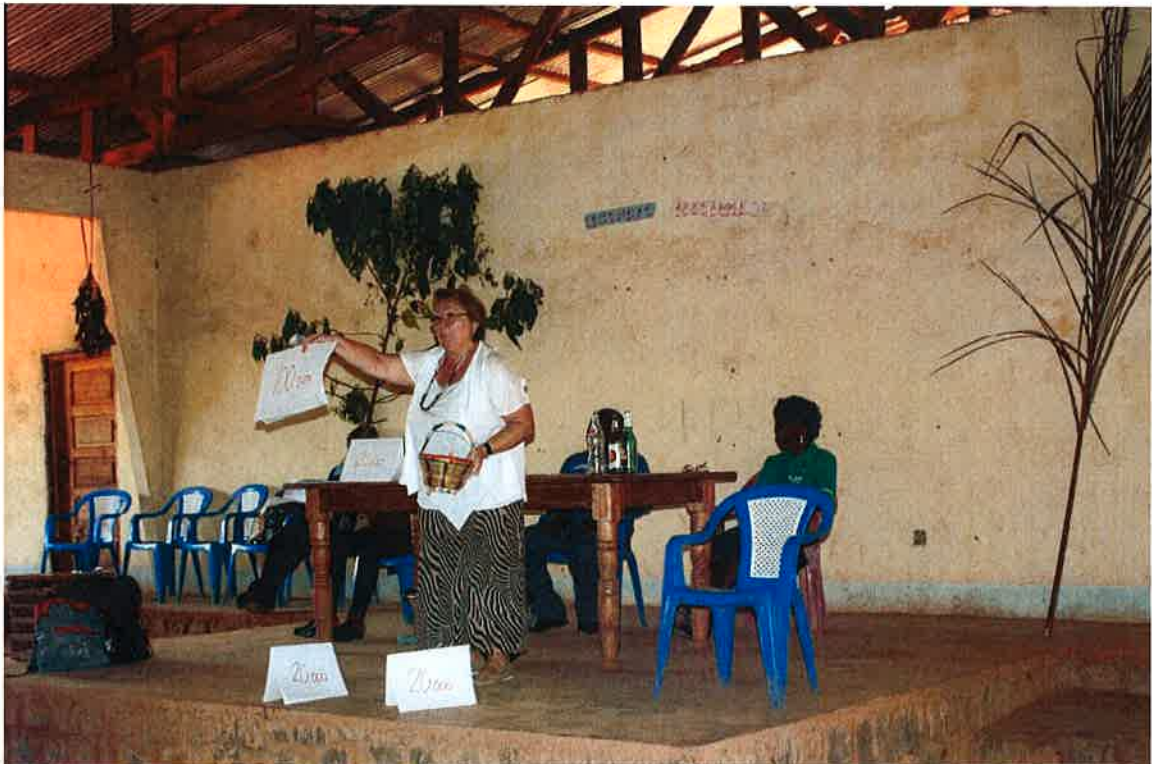
Et mangfold av tradisjoner er hemmende og ofte tabubelagt – bevisstgjøring må til.

De siste årene har vi også inkludert en modul av «endingsledelse», der vi prøver å påvirke holdningsendring i forhold til vante tradisjoner. Selvsagt i dyp respekt for deres kultur og tradisjoner som viser deres rikholdige historie. Vi prøver å synliggjøre hvilke tradisjoner som hemmer dem, og hvilke nye metoder som kan få dem over i en virkningsfull videreutvikling. Eksempelvis tidsforbruk på inntektsgenererende arbeid (som de bruker lite tid på) - kontra sosialt tidsforbruk (som de bruker mye tid på). På passiviserende holdning til å vente på hjelp utenfra - kontra hva man kan gjøre selv med de muligheter som finnes. Vi tar også opp forhold til korrupsjon og kjønnsfordelt arbeid. Og ikke minst bevisstgjøring av hva man braker penger på - kontra innsatsen for å skaffe penger.