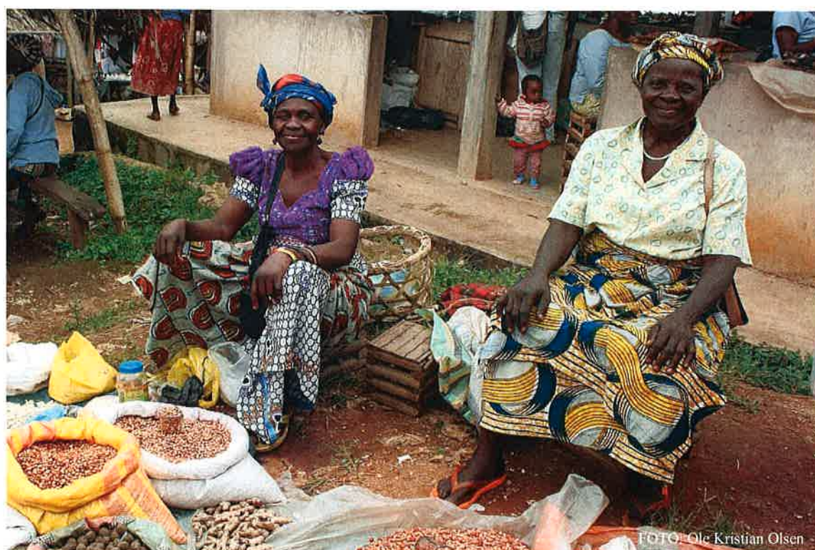
Sterke kvinner som lykkes. COF deltakere fra landsbyen Wumnebug

FNs mål for å bedre kvinners og jenters rettigheter og muligheter, måles ikke i våre statistikker. Men påvirkes bevisst gjennom det program som er etablert. Med krav til at minst 70% av låntakerne skal være kvinner, bidrar det til at kvinner får mulighet til å etablere sin egen inntekt og dermed øke sin egen status og selvstendighet. I alle COF lånegrupper er det kvinner som har de ledende roller, noe som også er tilfelle i et felles COF kompetanseforum de driver i lokalsamfunnet. Kvinnene får gjennom sin opplæring i planlegging og økonomiforvaltning tilført kompetanse de hittil har manglet gjennom skolegang. Mens opplæring og erfaringsutveksling i produksjonsutvikling og forretningsforståelse gjør dem til nøkkelressurser og mentorer for stadig flere i lokalsamfunnet. En gruppe på 12 av de mest driftige og suksessrike kvinnene er valgt til å representere alle lånegruppene, fordelt til å dekke hver sine soner av distriktet. Jo flere lånegrupper som startes, jo større andel av lokalbefolkningen vil disse representere. Deres roller og økende representasjon bidrar til at de kan få innflytelse på beslutninger og utvikling av sitt lokaldistrikt. Vi ser en tilnærming til en slik utvikling allerede.