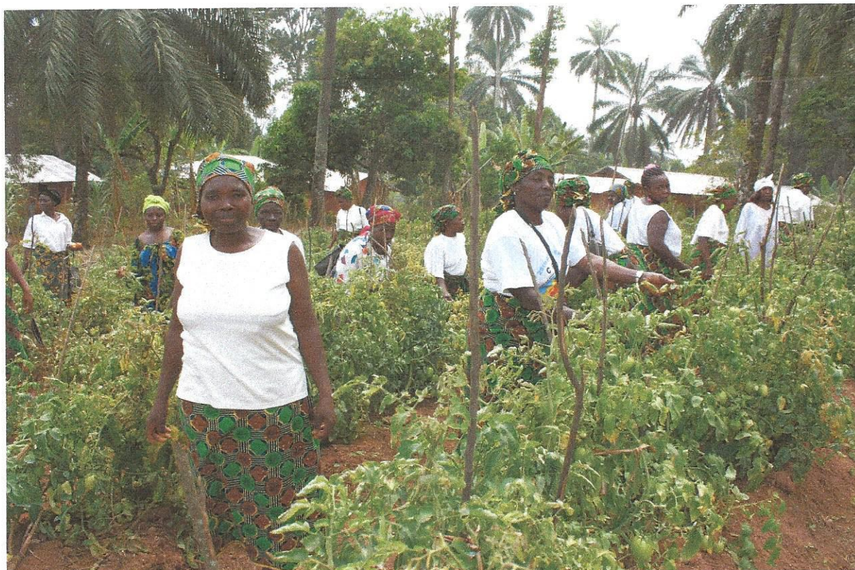
Gruppe 9 i landsbyen Wumnebug er en foregangsgruppe for andre i prosjektområdet

Gruppe 9 i landsbyen Wumnebug har vært med siden starten i 2008. De har hele tiden suksessfulle fellesprosjekt i tillegg til familienes egne. Med sikker økonomistyring har de alltid lyktes med tilbakebetaling i tide, og er nå i gang med sitt 10. investeringslån på 10 år. En gruppe som lever opp til COFs motto «I'm proud».