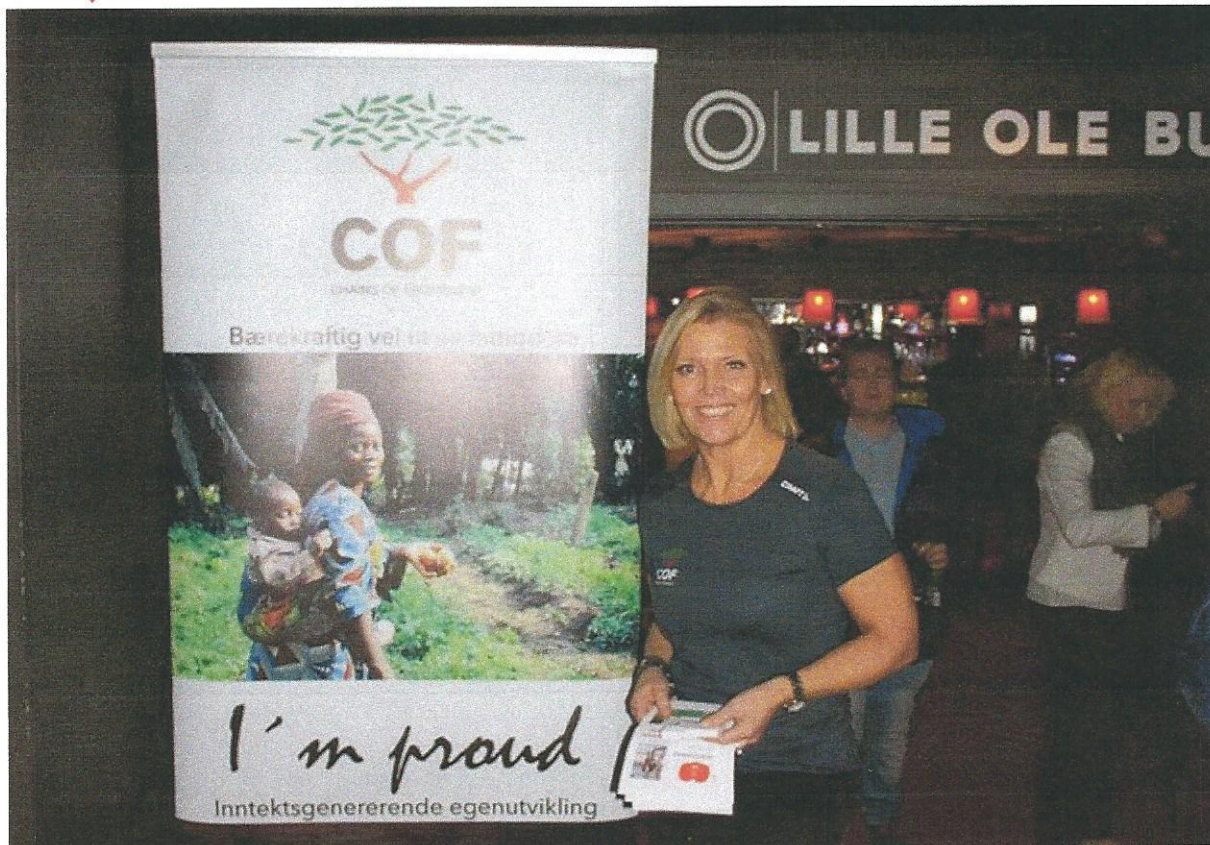
Bergen Gir veldedighetsfest – ledet av entusiastiske styremedlemmer

Chains of Friendship arrangerte også i 2017 veldedighetsfesten «BERGEN GIR» Arrangementet gir i tillegg til inntekt også en utvidelse av vår markedsprofilering.