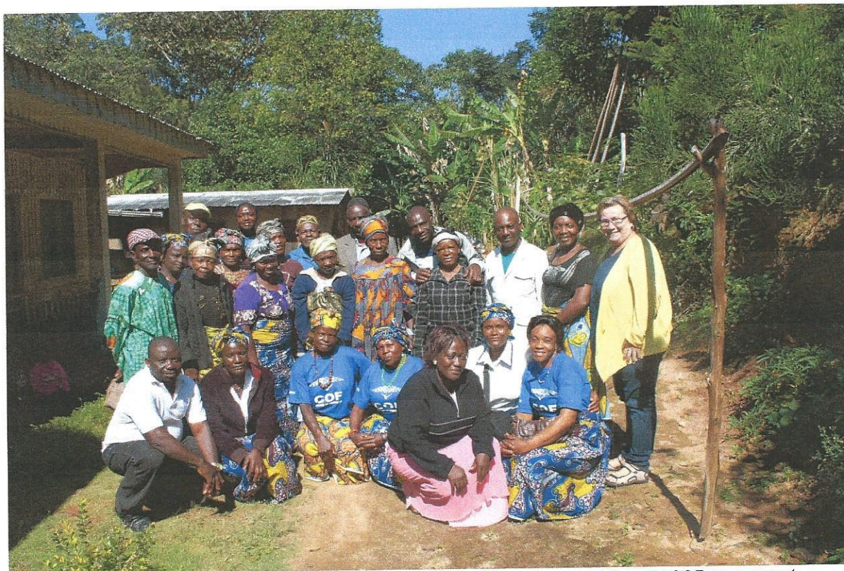
81 aktive grupper- 985 deltakere og deres ca. 10.000 familiemedlemmer deltar nå i COF programmet

Resultat av lokalsamfunnets fattigdomsutvikling, i tråd med stiftelsens formål, er omtalt på side 2 under «Utvikling». Der forbedring av fattigdomskriterier ihht FNs Tusenårsmål måles kontinuerlig på individ- og samfunnsnivå.