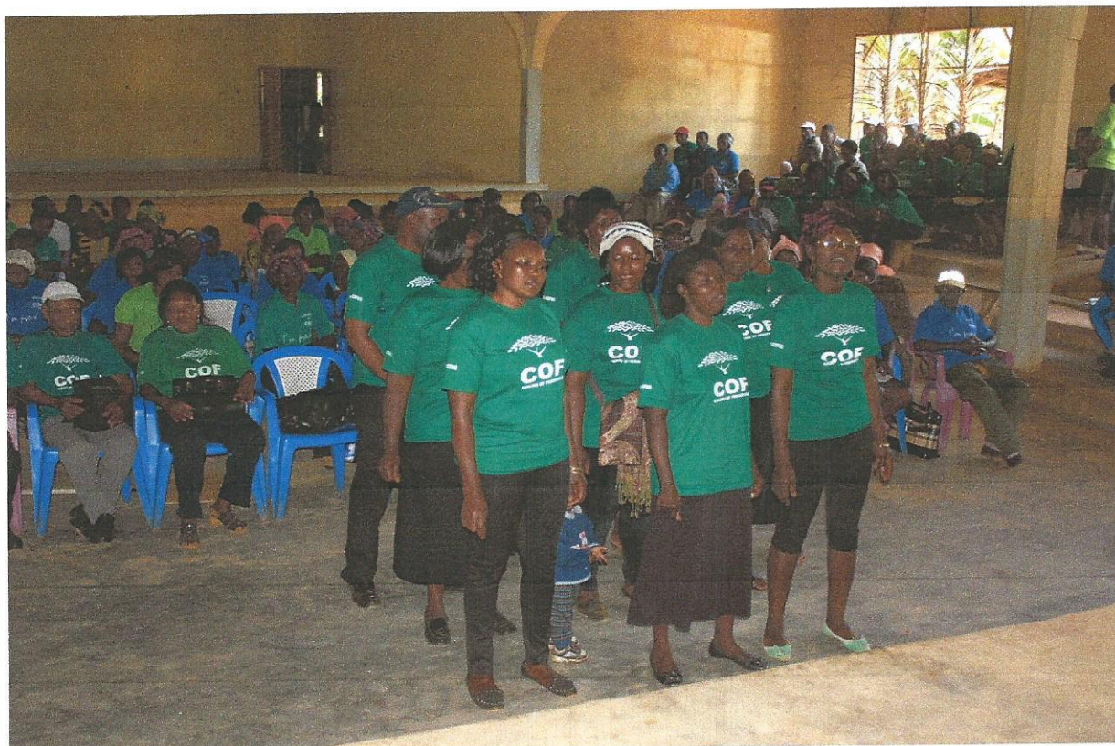
Månedlig kunnskapsforum – med erfaringsutveksling og samfunnspåvirkning

Det etablerte COF kunnskapsforum har pleid å ha faste månedlige møter med representanter for alle lånegruppene og et felles årsmøte for alle låntakerne. Dette forum har hatt stadig mer effekt. Både i utvikling av administrative og økonomiske ferdigheter, og i enda større grad av produksjonsutvikling. Enten som verdifull erfaringsutveksling, eller innleid profesjonell fagkompetanse. Lånegrupper som gjennom nytenking skaper bedre resultater, benyttes som besøksfarmer andre kan lære av. Den langsiktige planen har vært at dette kunnskapsforum kunne bli en permanent «voksenopplæringsinstitusjon» for lokalsamfunnet, uavhengig av COF. Et nytt tilbud i et lokalsamfunn der de fleste voksne har begrenset formell utdanning, og mange voksne kvinner er analfabeter.