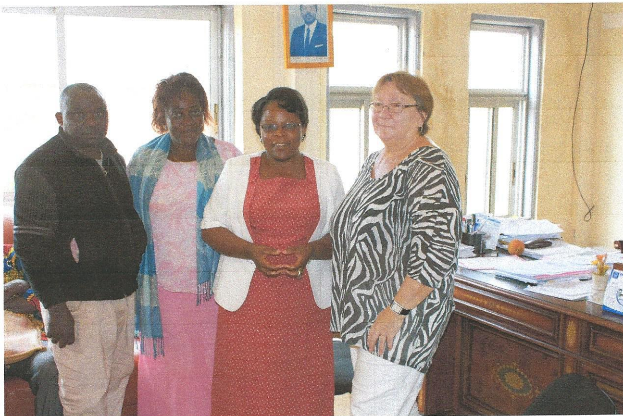
Møte med distriktets ordfører for å påvirke infrastruktur for en utviklende handelsnæring

De siste årene har vi også inkludert en modul av «endringsledelse», der vi prøver å påvirke holdningsendring i forhold til vante tradisjoner. Selvsagt i dyp respekt for deres kultur og tradisjoner som viser deres rikholdige historie. Vi prøver å synliggjøre hvilke tradisjoner som hemmer dem, og hvilke nye metoder som kan få dem over i en virkningsfull videreutvikling. Eksempelvis tidsforbruk på inntektsgenererende arbeid (som de bruker lite tid på) - kontra sosialt tidsforbruk (som de bruker mye tid på). På passiviserende holdning til å vente på hjelp utenfra - kontra hva man kan gjøre selv med de muligheter som finnes. Vi tar også opp forhold til korrupsjon og kjønnsfordelt arbeid. Og ikke minst bevisstgjøring av hva man braker penger på - kontra innsatsen for å skaffe penger.