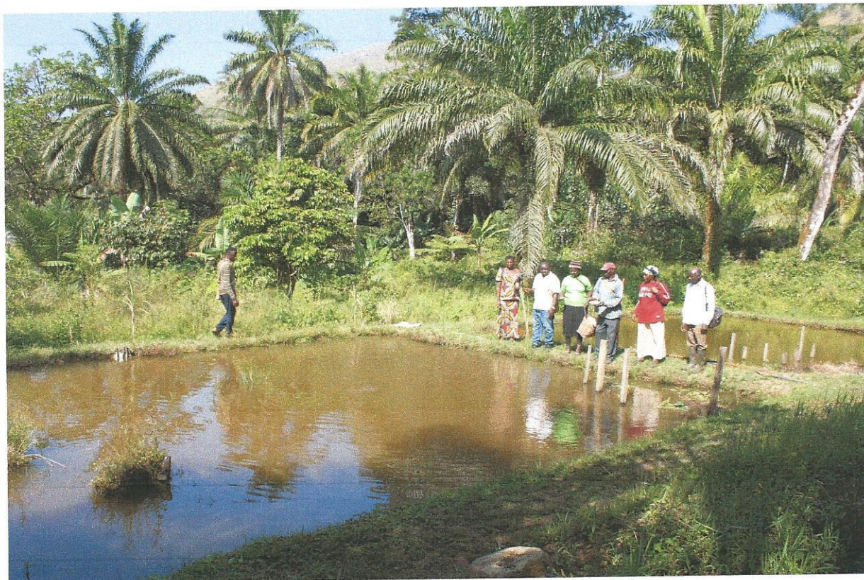
Fellesprosjekt er gruppens sikkerhet og ekstraintekt

Gruppe 8 i Wumnebug har vært med siden starten i 2008. De er en av de minste gruppene, men det har ikke hindret dem i å grave ut 2 fiskeoppdretts dammer for hånd. Fellesprosjekt for hele gruppen, og nyskapende ifht å gå nye veier i inntektsutvikling.