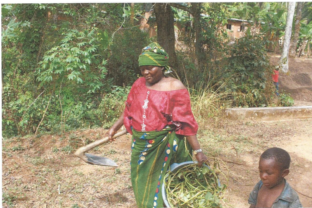
Sterke kvinner som gjennom hardt arbeid og litt COF investeringskapital bringer sin familie ut av fattigdom

FNs mål for å bedre kvinners og jenters rettigheter og muligheter, måles ikke i våre statistikker. Men påvirkes bevisst gjennom det program som er etablert. Med krav til at minst 70% av låntakerne skal være kvinner, bidrar det til at kvinner får mulighet til å etablere sin egen inntekt og dermed øke sin egen status og selvstendighet. I alle COF lånegrupper er det kvinner som har de ledende roller, noe som også er tilfelle i et felles COF kompetanseforum de driver i lokalsamfunnet. Kvinnene får gjennom sin opplæring i planlegging og økonomiforvaltning tilført kompetanse de hittil har manglet gjennom skolegang. Mens opplæring og erfaringsutveksling i produksjonsutvikling og forretningsforståelse gjør dem til nøkkelressurser og mentorer for stadig flere i lokalsamfunnet. En gruppe av de mest driftige og suksessrike kvinnene er valgt til å representere alle lånegrupperne, fordelt til å dekke hver sine soner av distriktet. Jo flere lånegrupper som startes, jo større andel av lokalbefolkningen vil disse representere. Deres roller og økende representasjon bidrar til at de kan få innflytelse på beslutninger og utvikling av sitt lokaldistrikt. Vi ser en tilnærming til en slik utvikling.